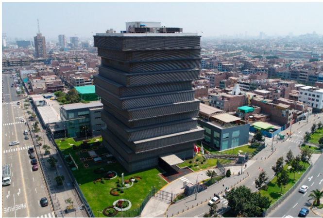
Ministerio de educación del Perú. Una aproximación al modelo educativo

En opinión de Pinilla (1966) la historia de la educación republicana se inicia con el general José de San Martín, quien puso especial interés en la instrucción pública como la primera necesidad de los peruanos, que tenía como finalidad integrar a las poblaciones indígenas, a quienes, dijo no debe