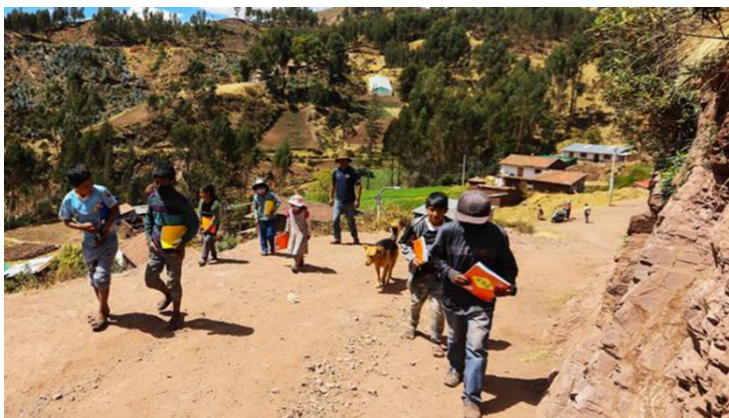
Misión y visión de la educación peruana Fuente: diario Perú 21. Autor Jorge Ysusqui

Según el Ministerio de Educación, la visión de la educación peruana es; garantizar derechos, asegurar servicios educativos de calidad y promover oportunidades deportivas a la población para que todos puedan alcanzar su potencial y contribuir al desarrollo de manera descentralizada, democrática, transparente y en función a resultados desde enfoques de equidad e interculturalidad. Ministerio de Educación (2020).