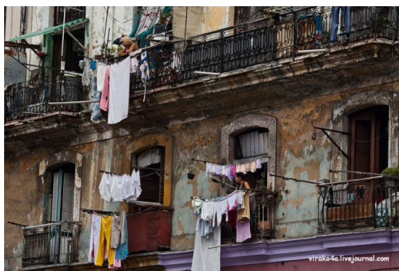
Modelo Educativo socialista