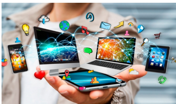
Modelos educativos eficientes en el mundo

Sin embargo, a la fecha en el Perú el mencionado modelo educativo no refleja la operacionalización de la política de estado, que permita articular la gestión académica, pedagógica e institucional, en el contexto de la realidad peruana.